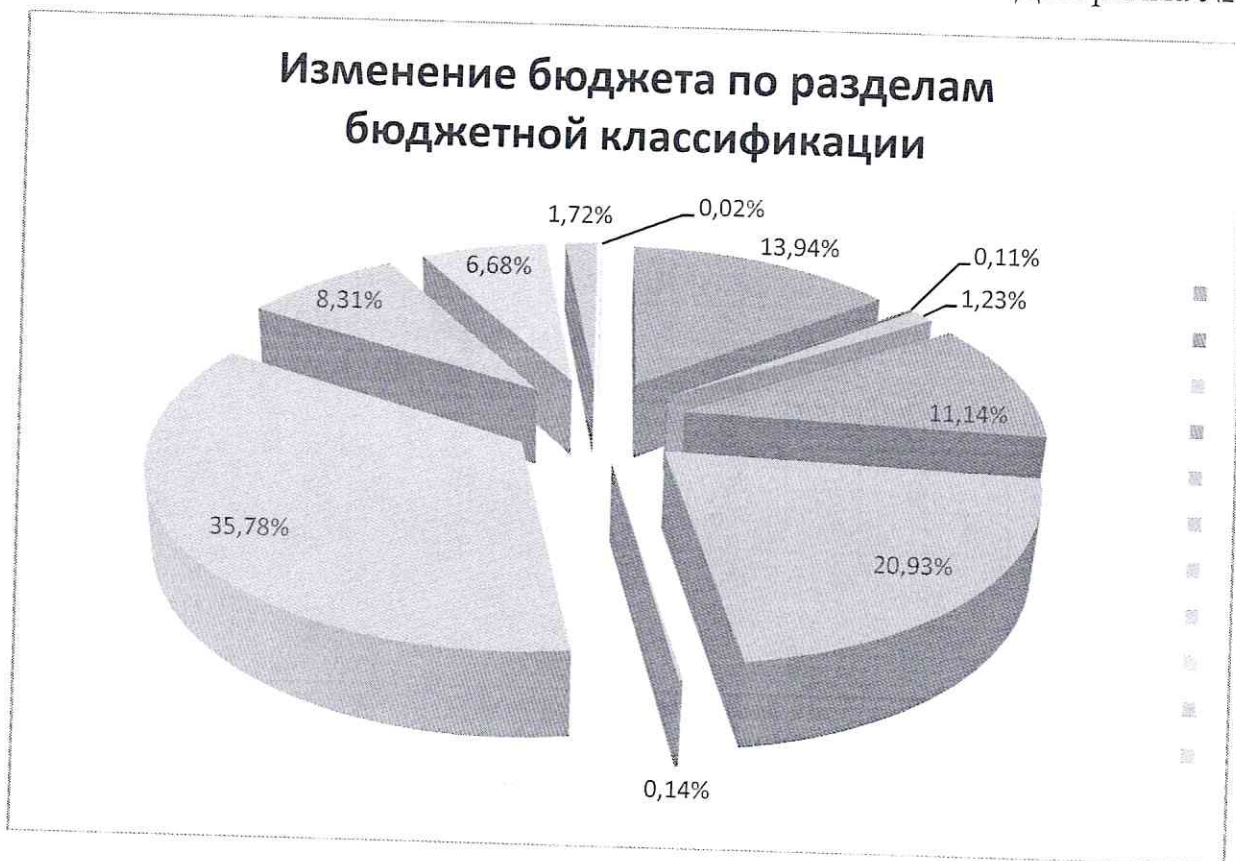
Диаграмма № 2

Структура изменения расходов местного бюджета в 2023 году по разделам бюджетной классификации представлена в Диаграмме №2 настоящего заключения.