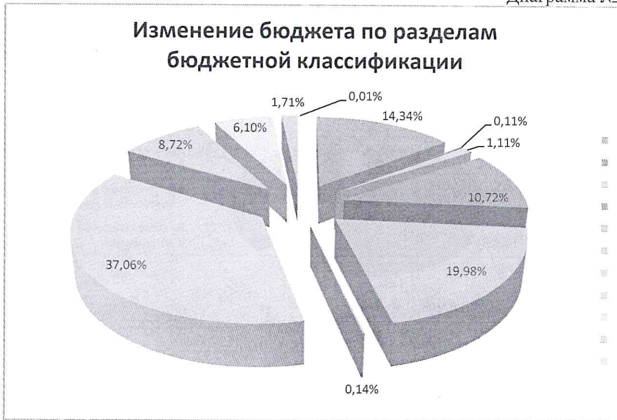
Диаграмма № 2

Структура изменения расходов местного бюджета в 2023 году по разделам бюджетной классификации представлена в Диаграмме № 2 настоящего заключения.