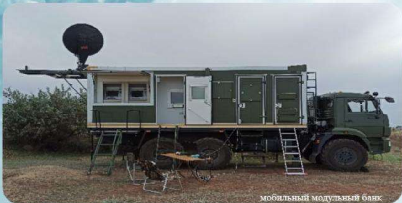
мобильный модульный банк