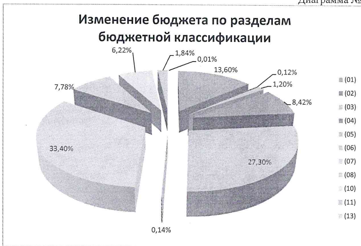
Диаграмма № 2

Структура изменения расходов местного бюджета в 2024 году по разделам бюджетной классификации представлена в Диаграмме № 2 настоящего заключения.