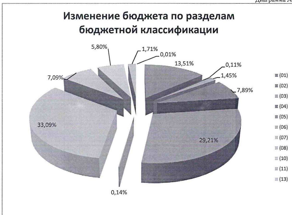
Диаграмма № 2

Структура изменения расходов местного бюджета в 2024 году по разделам бюджетной классификации представлена в Диаграмме № 2 настоящего заключения.