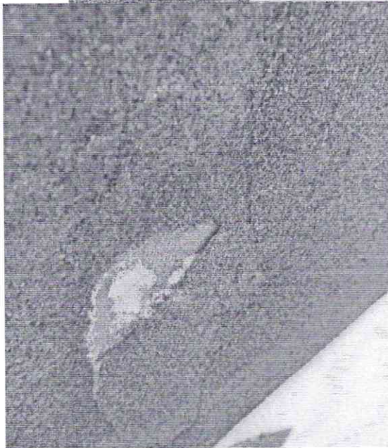
Φοτο Νο 1.