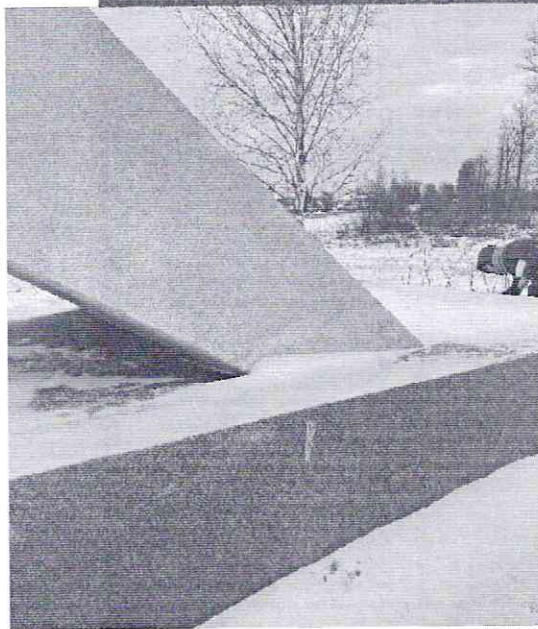
Фото № 3.