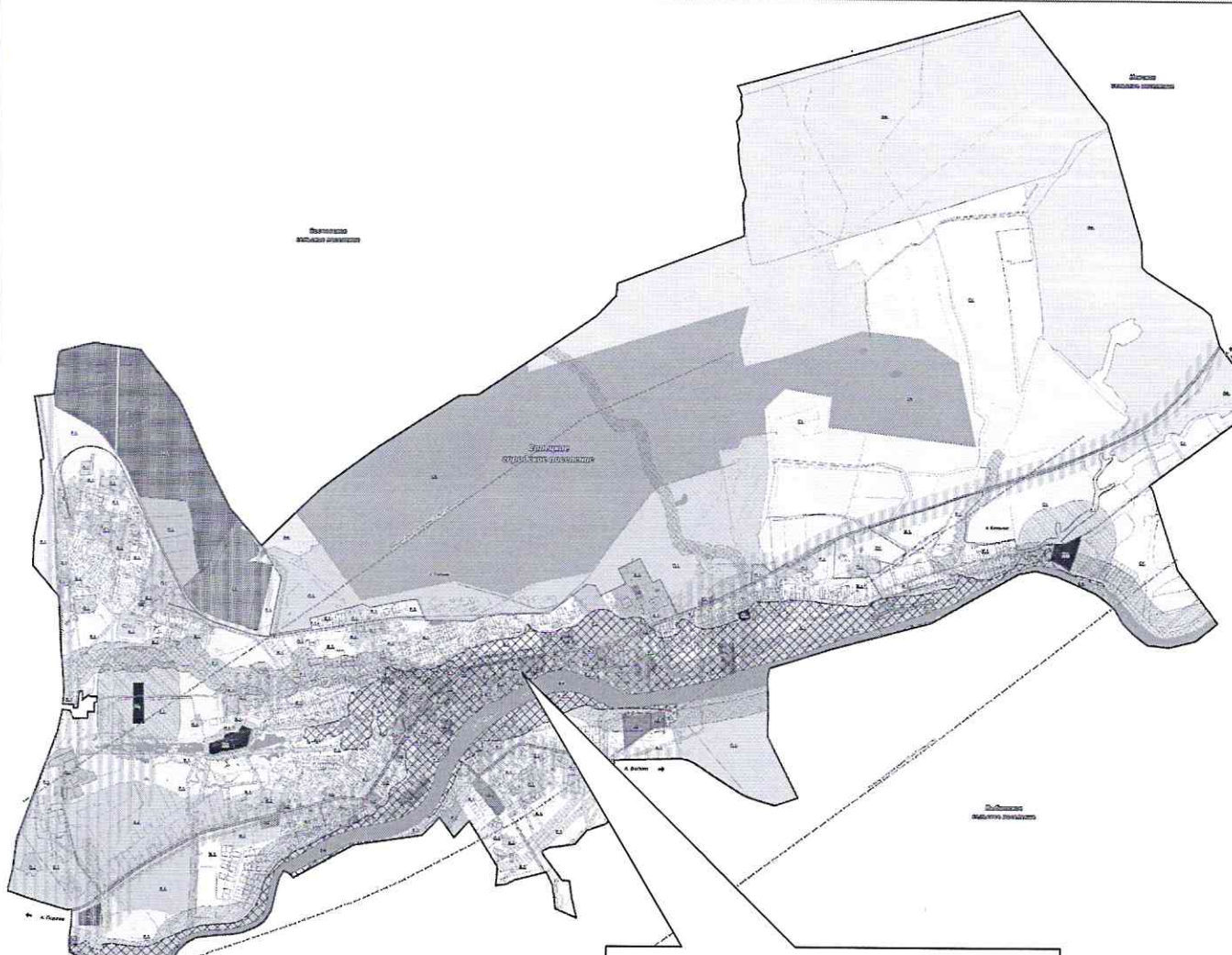
Расположение дворовой территории на схеме Солецкого городского поселения

Данная зона выделена для обеспечения правовых условий формирования кварталов комфортного жилья на территориях застройки при невысокой плотности использования территории и преимущественном размещении многоквартирных домов не выше 3 этажей и многоквартирных жилых домов блокированной застройки.